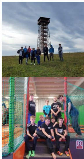
Foto-relacja z wyjazdu ministrantów

W sobotę 21 października Ministranci i Lektorzy korzystając z dobrej pogody ruszyli na wędrowkę. Jej celem była wieża widokowa w Desznicy. Następnie spędzali czas w parku trampolin. Oto kilka zdjęć z tego wyjazdu.